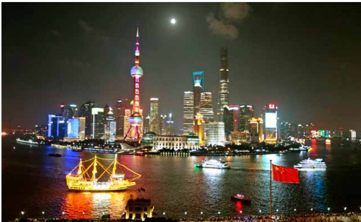
《夜上海》 集团办公厅 郝成涛