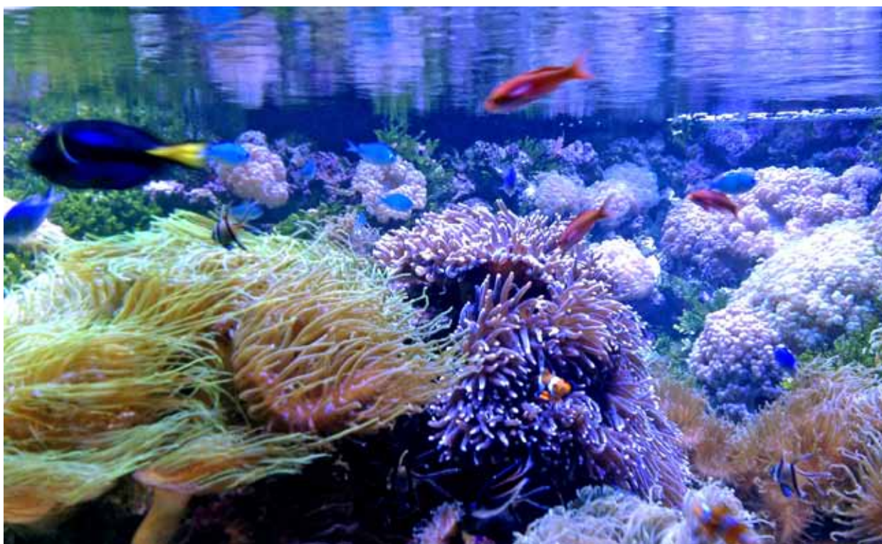
《多姿多彩的水下生物》 财务公司 苏明