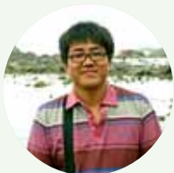
茹刚 新时代设计公司