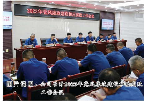
图片说明：公司召开2023年党风廉政建设和反腐败工作会议