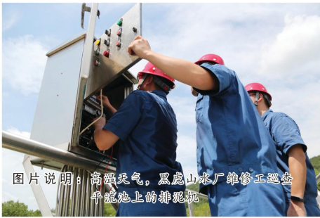
图片说明：高温天气，黑虎山水厂维修工巡池平流池上的排泥泵

制水工就这样一次次出入泵房，接受高温的锤炼，脸上的汗水不断滴落在地上，也依然坚守岗位职责。他们将意志注入灵魂，用行动诠释着水务人的初心，将合格自来水送入千家万户。（刘焜昱）