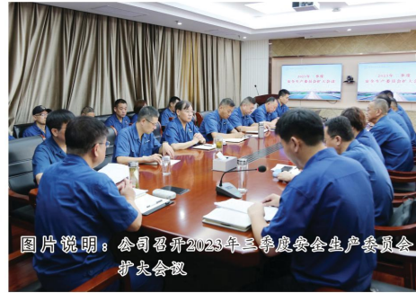
图片说明：公司召开2023年三季度安全生产委员会扩大会议