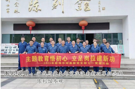
图片说明：营业所党支部前往怀远县烈士陵园陈烈烈馆参观

结尾：通过参观学习，党员们纷纷表示，从烈士们的光辉事迹中汲取精神养分，锤炼党性修养，锻造崇高品格，转化为铿锵前行的力量，积极投身于供水事业的发展中。