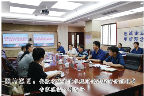
图片说明：安徽省城市供水规范化达标评审组领导专家莅临公司指导

7月20日上午，供水工程分公司组织全体职工在公司大院开展了灭火器操作演练活动，演练分为现场模