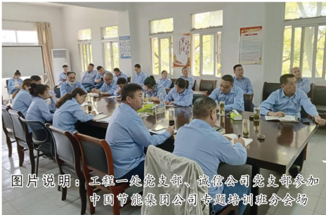
图片说明：工程一处党支部、诚信公司党支部参加中国节能集团公司专题培训业务会场