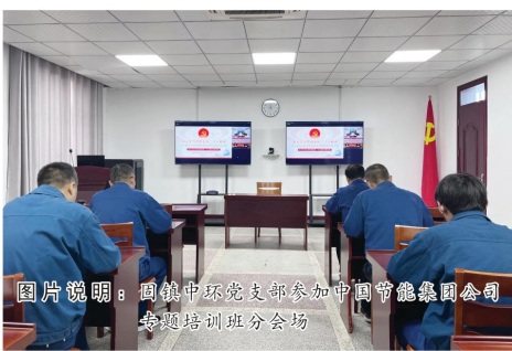
图片说明：固镇中环党支部参加中国节能集团公司专题培训班会会场