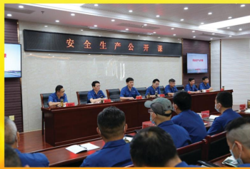
召开2021年安全生产工作会议