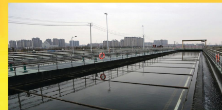
固镇中环污水厂二期建设完工并投入使用