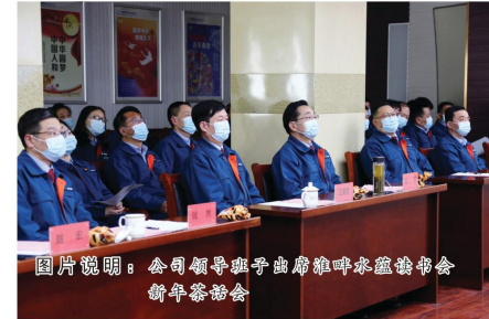
图片说明：公司领导班子出席淮畔水蕴读书会新年茶话会

冬渐深，雪渐至，寒风顺峭听风雪。2022年1月26日下午，在公司二楼会议室举办了淮畔水蕴读书会