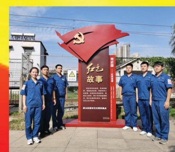
加强革命传统教育，传承红色基因