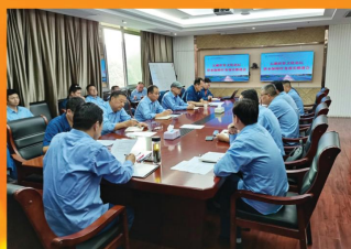
召开太湖论坛供水保障任务落实推进会