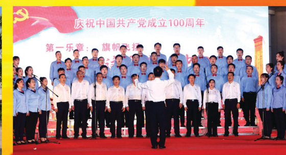
举办庆祝中国共产党成立100周年《颂歌献给党》歌乐会