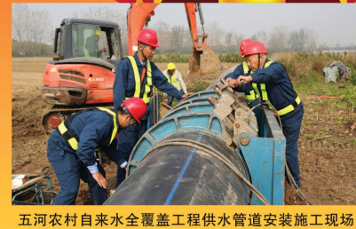
五河农村自来水全覆盖工程供水管道安装施工现场