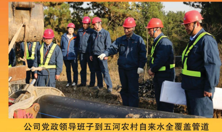
公司党政领导班子到五河农村自来水全覆盖管道安装施工现场检查工作