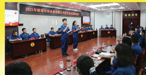
开展党史知识竞赛