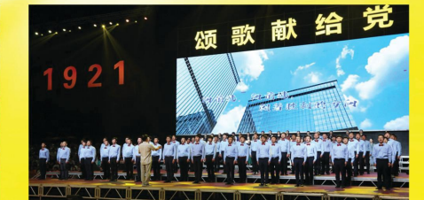
参加蚌埠市庆祝中国共产党成立100周年大型文艺演出