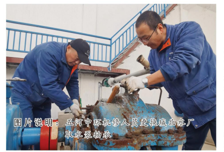
图片说明：五河中环供水人员安装城北水厂泵房泵房泵房

造成堵塞及人员伤害的恶劣环境，深入现场勘查，并对泵房内部通风、排水等设施位置现场加以确认，对原设计加以优化。我们与开发建立联系，询问开工时间并要求泵房土建建设按照《二次供水标准化泵房规范》进行施工。部门人员还跟踪施工进度进行现场不定期检查，按照《二次供水泵房建设标准化泵房规范》的要求，发现问题及时整改。土建装饰结束后，经检查合格后通知工程三处、信息中心进行泵房设备施工，泵房竣工验收合格后，由部门负责对生活泵房加压设施进行日常管理和维护。目前，蚌埠市在建泵房严格按照《蚌埠中环水务有限公司二次供水标准化泵房建设规范》进行建设。二供泵房建设标准化、规范化的实施为提升用户生活质量和提高二次供水泵房管理的效率打下了坚实基础。（侯瑞博）