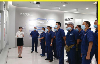
复退军人迎“八一”研学活动