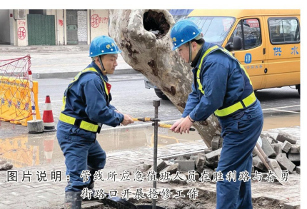
图片说明：管线所应急值班人员检查胜利路沿河路路口开渠抢修工作

春节期间，管线的巡查和维护工作尤为重要。为确保春节期间全市供水管网安全运行，管线所坚持早谋划、早部署，采取多项举措，积极做好节日期间保供水的各项准备工作。春节前夕，管线所按照公司《关于做好2022年元旦、春节期间疫情防控、安全生产工作的通知》要求，加强对全市供水主干管、重点部位市政消火栓、排气阀及阀门井等供水设施的巡查力度，结合全市顶管、挖掘工程施工进度，做好备案记录，以便能够准确掌握掘土情况，及时消除安全隐患，确保供水安全。为进一步保证抢险、维修工作的顺利开展，节前对仓库各口径维修材料进行了清点与找补，确保维修材料齐备，对工程车辆、抢修设备、三相发电机进行了检查与保养，确保备用设备时刻处于良好待命状态。同时，严格按照公司疫情防控要求，统计四支储备外协队伍待命人员名单，登记个人信息、疫苗接种、行程码等防疫信息，要求工作人员要固定，避免接触风险人员，异常情况早报备，确保疫情防控不松懈。切实做好人、机、料以及外协队伍和大型抢修设备的储备，全力保障节日期间供水管网安全运行。此外，坚持做好24小时应急值班部署，并在原有值班人员的基础上，适时增加值班人员力量，强化兜底功能。同时做好随时应对极端天气的充分准备，未上班人员居家待命，保持电话畅通，及时了解掌握天气变化和降雪情况，一旦遭遇极寒天气来袭，随时启动应急响应，保证人员、设备全部迅速投入，确保各项工作能够快速反应、妥善处置。春节期间，管线所应急值班人员在有序处理各项日常工作的同时，坚持每天对黑虎山水厂原水管、输水干管以及穿堤管道巡查，在巡查中发现胜利路与奋勇街东北角DN100mm铸铁管漏水，并立即组织人员进行现场定点维修，保障了居民的用水安全。在千家万户享受春节团圆的幸福时刻，供水人积极发扬“三牛”精神，舍小家顾大家，默默地坚守奉献，全力以赴做好从“源头”到“水龙头”的全过程服务和保障，积极为全市居民营造祥和的春节氛围。（余忠田）