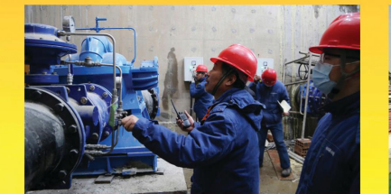
马城水厂取水泵房调试通水