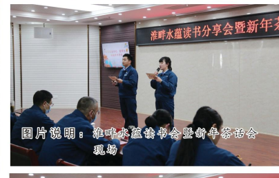
图片说明：淮畔水蕴读书会暨新年茶话会现场