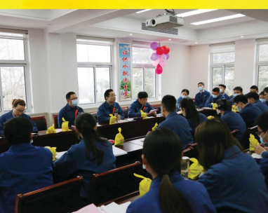
蚌埠中环淮水阅读俱乐部按月举办读书分享会