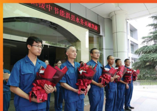
表彰驰援中节能淇县水务抢修队