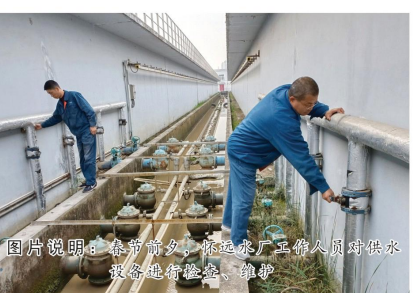
图片说明：春节期间，远运水厂工作人员对供水设备进行巡检、维护

自入冬以来，我市大部分区域出现降温，最低气温降至-8℃左右。每年寒潮来临时，极端低温天气造成不少户外水管爆裂，尤其是楼层较低的居民，频频发生水管冻结、水表冻裂等情况。严寒天气是对城市供水的一种考验，必须做好准备，防患于未然。蚌埠中环水务在入冬前已积极行动，完善应急预案，全面做好冬季安全供水及两会期间供水保障工作，全力护航冬季供水“生命线”。