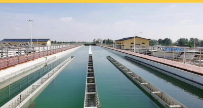
运行中的怀远常坟水厂