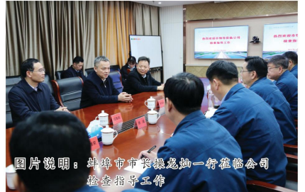
蚌埠市市长操龙灿一行莅临公司检查指导工作

慰问困难党员、困难职工家庭生活状况和实际存在的困难，对党员干部职工多年来为党的事业、为蚌埠中环建设所作出的贡献表示了感谢，向他们致以节日的祝福并送上慰问品。大家对蚌集集团一如既往的支持公司工作，齐心协力推动公司发展。与此同时，市总工会、中环水务工会也分别通过走访和视频方式，对公司困难党员职工表示了真诚的关心和问候。春节前夕，蚌埠中环开展了“送温暖”活动，公司党政领导班子成员分成四组分别对蚌埠市区及固镇、五河、怀远三县水司进行了节前慰问与安全生产检查、疫情防控检查，向公司全体职工特别是战斗在生产一线的职工们送去节日的祝福，对大家过去一年的辛勤工作与积极贡献表示感谢，希望广大干部职工在新的一年里，以崭新的精神面貌和最佳的工作状态，踔厉奋发、笃行不怠，为企业高质量发展做出新的贡献。节前一系列慰问活动，让全体职工深刻感受到党和政府的关心关怀，充分感受到企业大家庭的温暖，增强了职工的获得感、幸福感和归属感。职工们纷纷表示，在新的一年里将继续秉承优良传统，凝心聚力，用最饱满的斗志迎接新的一年。（本报记者）