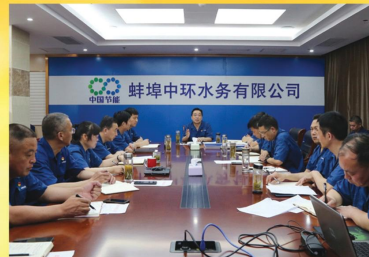
开展新一轮深化“三个以案”警示教育