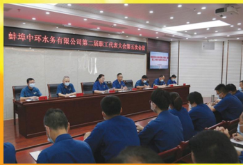
召开第二届职工代表大会第五次会议