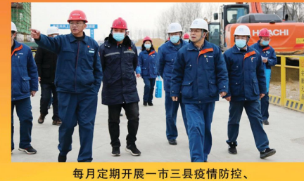
每月定期开展一市三县疫情防控、安全生产、文明创建大检查