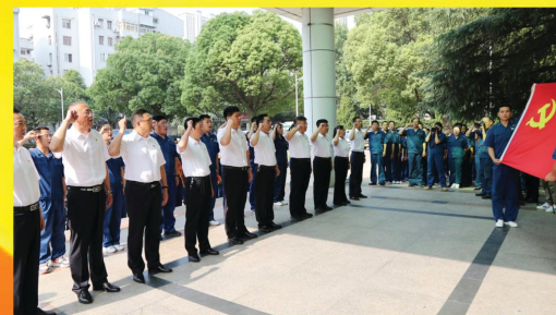
举行庆祝中国共产党成立100周年暨2020年度“两先两优”表彰大会