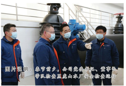
图片说明：春节期间，公司值班人员、董事长带队检查黑虎山水厂安全巡查值守

春节期间，返乡人员增多，居民用水需求量激增，淮河又处于枯水季节，低温低浊水处理难度加大，供水安全保障任务显著加剧。为确保春节期间市区供水安全，让居民度过一个欢乐、祥和的春节，蚌埠中环水务有限公司提早部署，积极采取多项举措，认真做好春节期间安全优质供水的各项准备工作。