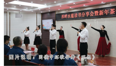
图片说明：固镇中环歌伴舞《理想》