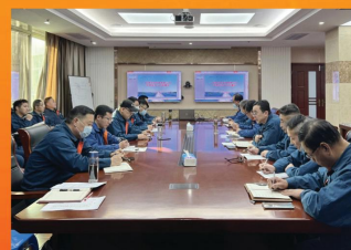
召开冬季防冻工作部署会