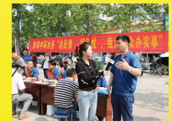
“访民情、解民忧、我为群众办实事”政风行风进社区志愿服务活动现场