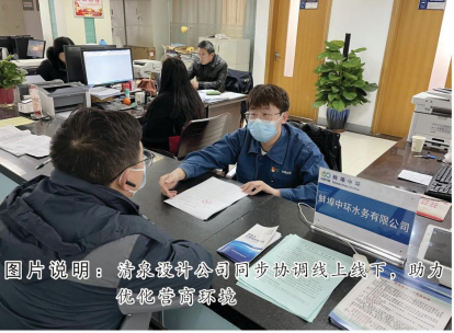
图片说明：清泉设计公司同步协调线上接单，助力优化营商环境

在施工前，有外线工程需要办理路面破路等相关手续，考虑到用户对于办理路面破路的程序不太熟悉，供水分公司综合部安排专人积极与用户沟通，为用户办理破路等相关手续，这样不仅能够节约大量的时间，而且也能为项目能够顺利的施工奠定了坚实的基础。对标其他城市的先进做法，我们仍有需要提高和改进之处，本着“严谨、务实、高效”的工作作风和“用户至上、热心服务”的服务理念，进一步拓宽