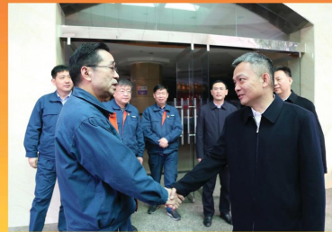
蚌埠市市长龙灿一行到公司调研指导工作