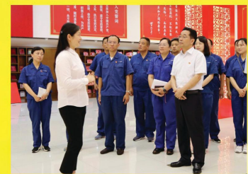
蚌埠中环水务与虹亚集团开展党史学习教育联学共建活动