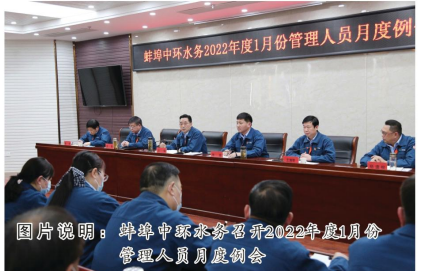
蚌埠中环水务召开2022年1月份管理人员月度例会