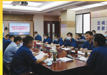
开展党史学习教育专题研讨