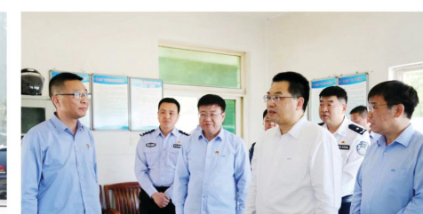
图片说明：蚌埠中环党委理论学习中心组第四次学习暨党纪学习教育专题读书班

会议指出，在全党开展党纪学习教育，是以习近平总书记为核心的党中央作出的重大决策部署，也是从政治高度向纵深发展的重要举措。要以更高站位、更高标准、更实作风组织开展好这次学习教育，进一步严明党的纪律和规矩，教育引导党员干部深刻领悟“两个确立”的决定性意义，增强“四个意识”，坚定“四个自信”，坚决做到“两个维护”，自觉在思想上政治上行动上同以习近平同志为核心的党中央保持高度一致。